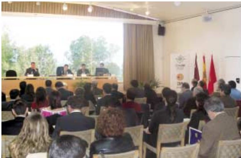
Vista del público.

Uno de los resultados del proyecto es el Crédito ReIntegra , producto financiero de condiciones preferentes destinado a facilitar las inversiones de las pymes para su adaptación medioambiental